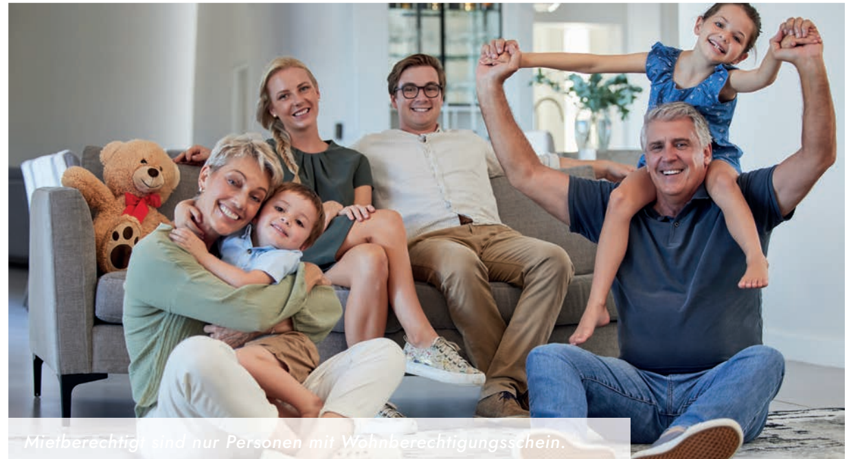
Mietberechtigt sind nur Personen mit Wohnberechtigungsschein.

Wenn Sie an einer Besichtigung interessiert sind oder mehr über die Wohnanlage in Peine erfahren möchten, freuen wir uns über Ihre Anfrage.