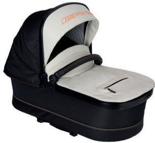
Falttasche Premium 4078-07-851