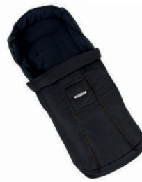
Fußsack AMG GT² 5840-63-851