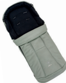
Winterfußsack GTX 5829-63-847 Winterfußsack GTS/GTR 5846-63-847