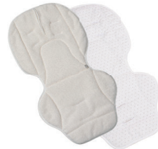
Wendeauflage „cozy“ GTX/GTS 5843-00-847 Wendeauflage „cozy“ GTR 5848-00-847