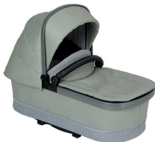
Falttasche Premium 4077-07-847