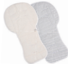
Wendeauflage „cozy“ 5844-00-851