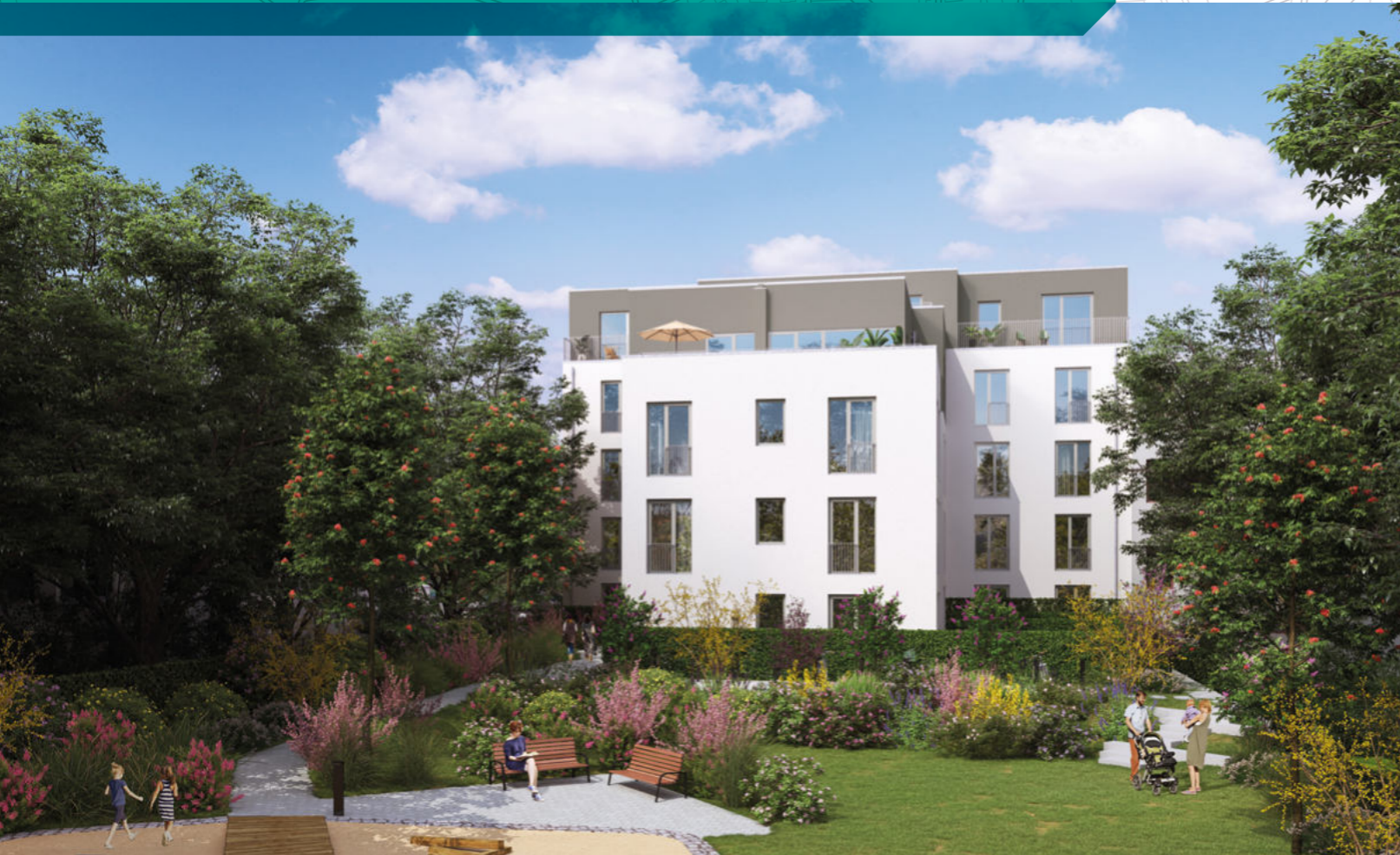
Berlin-Mariendorf | Kurfürstenstraße