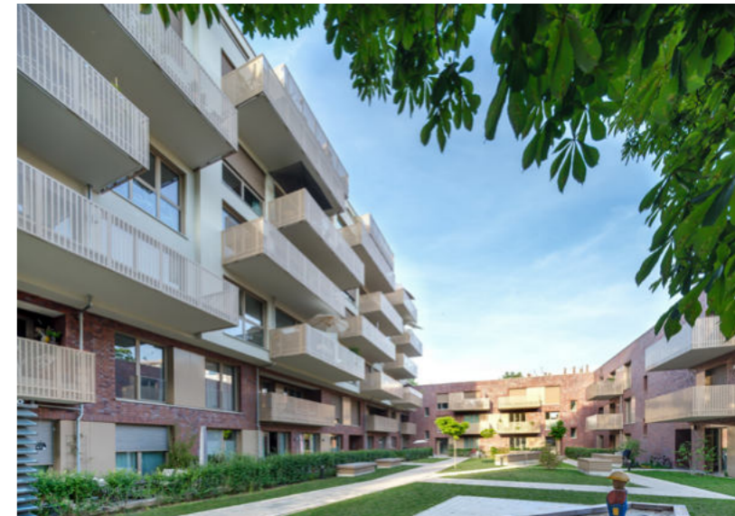
Berlin-Friedrichshain | Gartenhaus

Wir von der Niederlassung Berlin sind Ihr Ansprechpartner vor Ort. Wir nutzen die Erfahrung einer 75-jährigen Unternehmenstradition. Unsere Kunden können auf die Zuverlässigkeit unserer Versprechen und auf die Sicherheit der Projektdurchführung vertrauen.