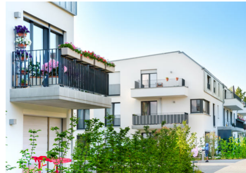
Berlin-Mariendorf | Britzer Straße