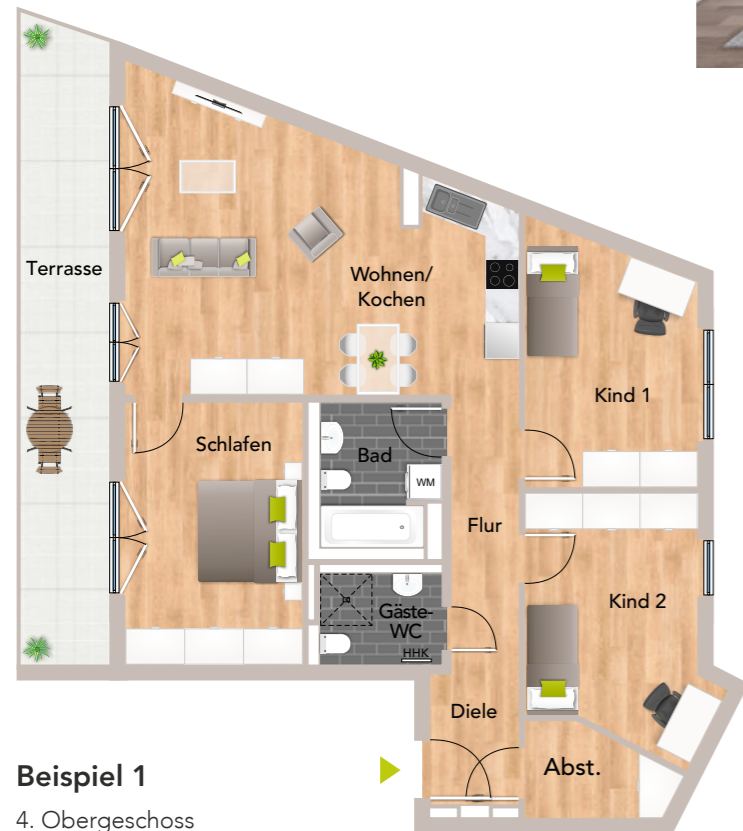
Beispiel 1 4. Obergeschoss 4 Zimmer