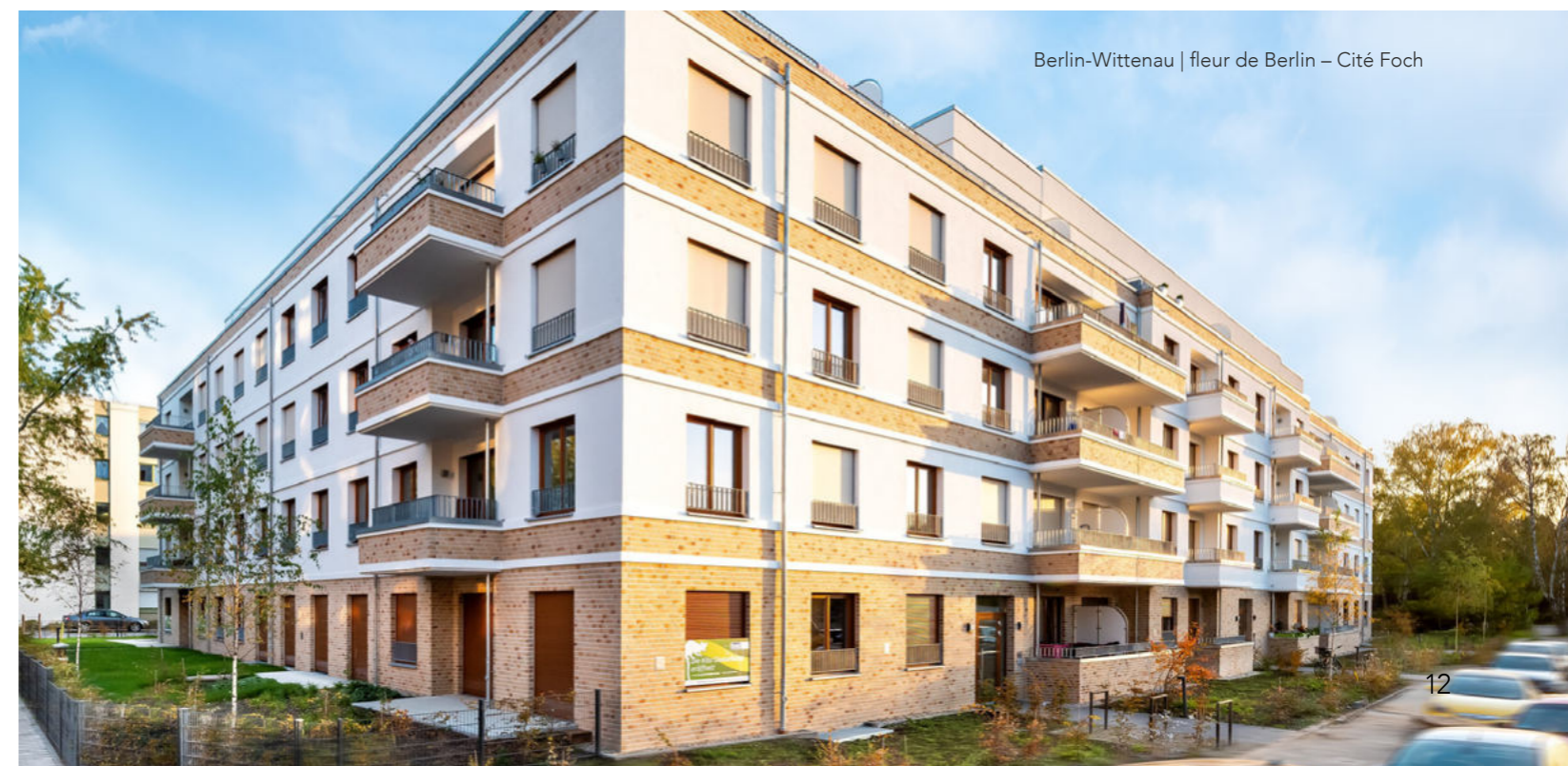
Berlin-Wittenau | fleur de Berlin – Cité Foch