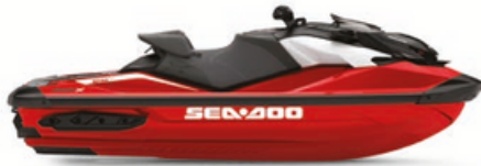
● NEU Fiery Red Premium