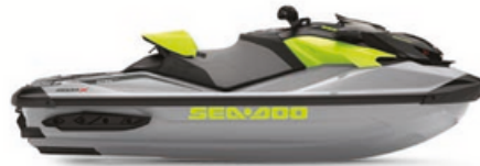
● NEU Ice Metal & Manta Green