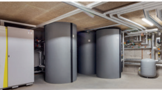
Wohnanlage Obdorfweg, Bludenz

Mit FORSTNER® ergeben sich unbegrenzte Einsatzmöglichkeiten