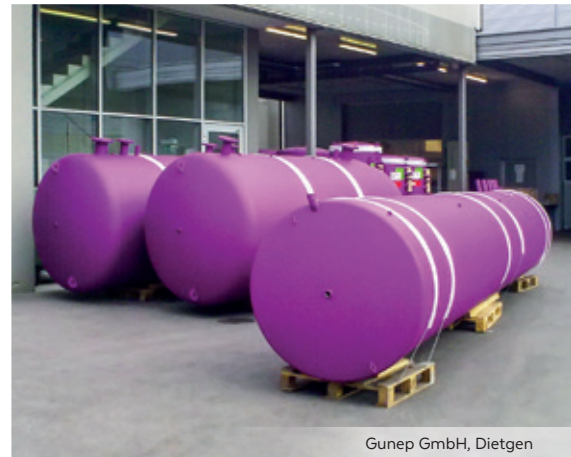
Gunep GmbH, Dietgen