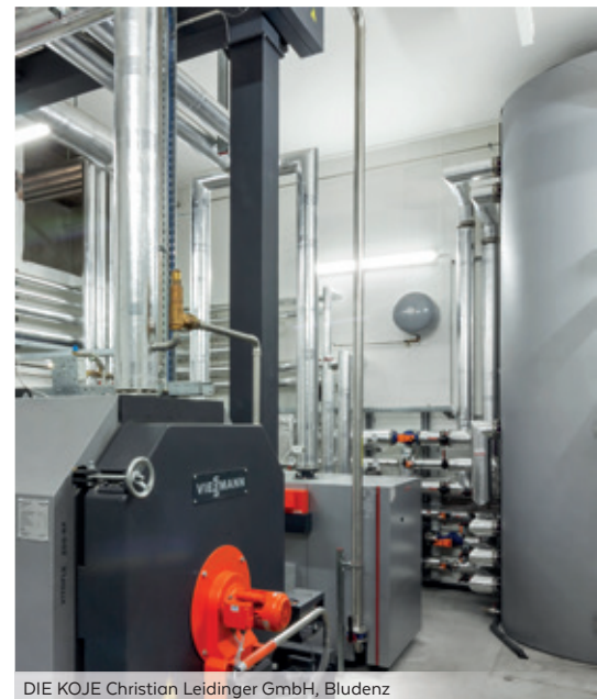
DIE KOJE Christian Leidinger GmbH, Bludenz