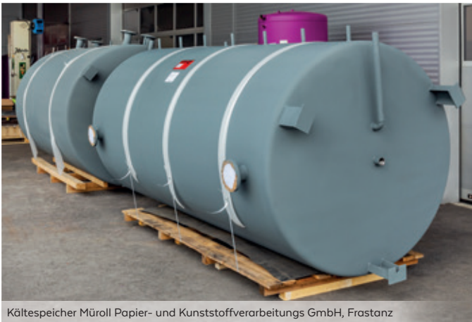
Kältespeicher Müroll Papier- und Kunststoffverarbeitungs GmbH, Frastanz