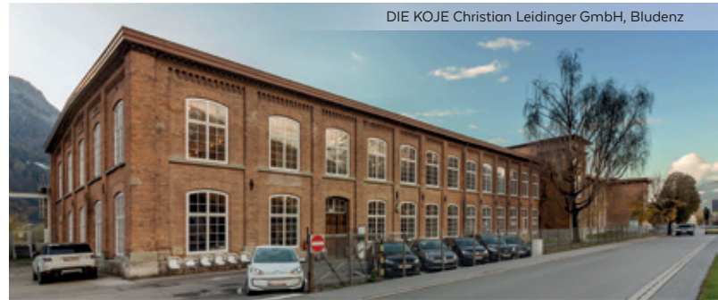
DIE KOJE Christian Leidinger GmbH, Bludenz