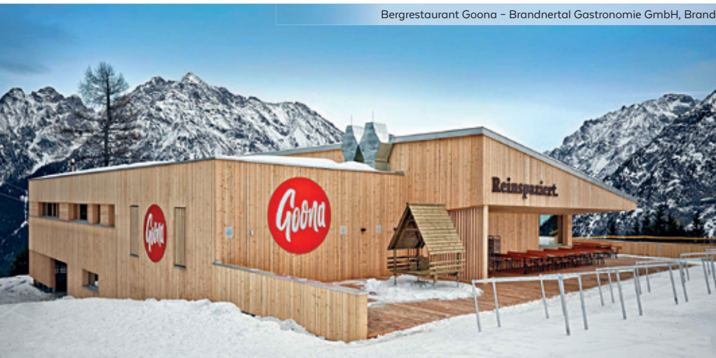
Bergrestaurant Goona – Brandnertal Gastronomie GmbH, Brand