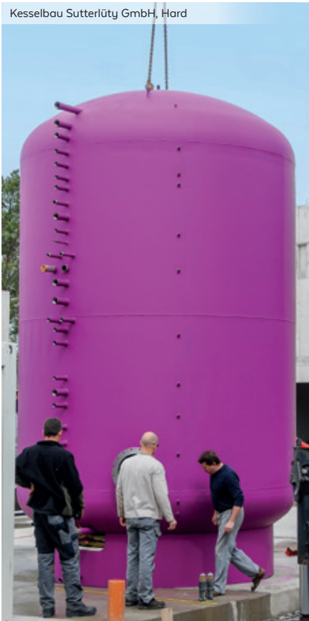
Kesselbau Sutterlüty GmbH, Hard