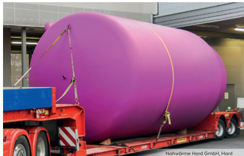
Nahwärme Hard GmbH, Hard