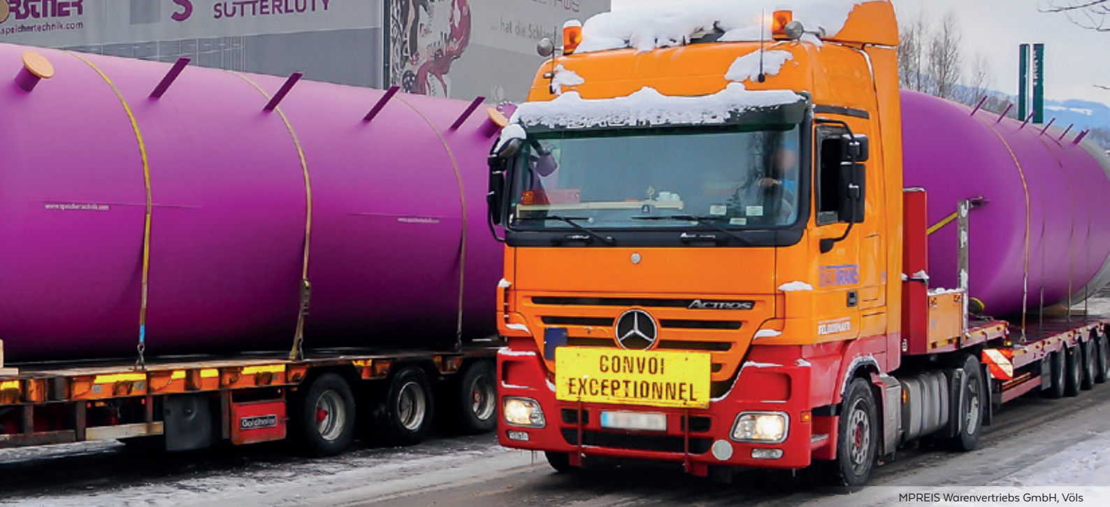
MPREIS Warenvertriebs GmbH, Völs