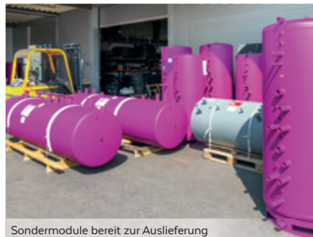
Sondermodule bereit zur Auslieferung