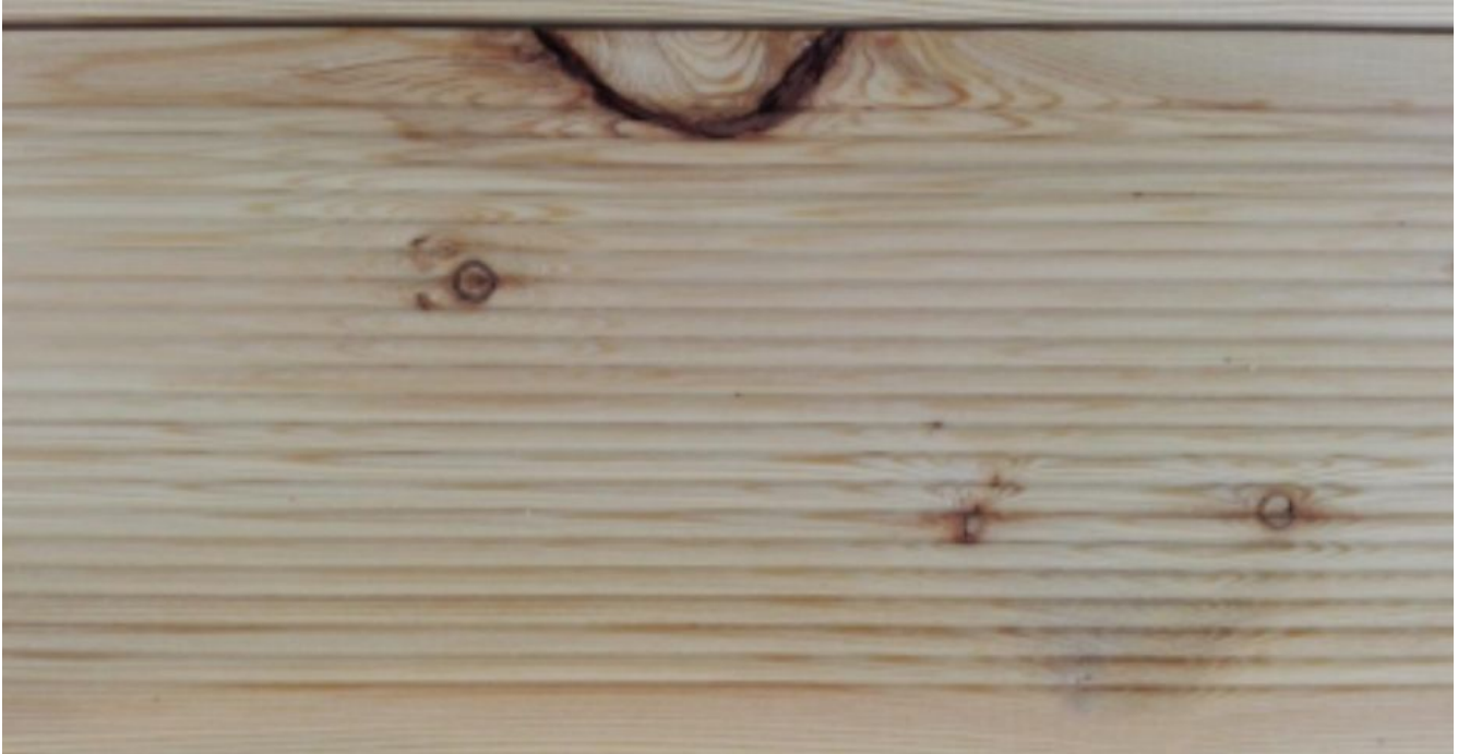
Foto 15 – ein seitlich gelegener Ast mit der eingewachsenen Rinde