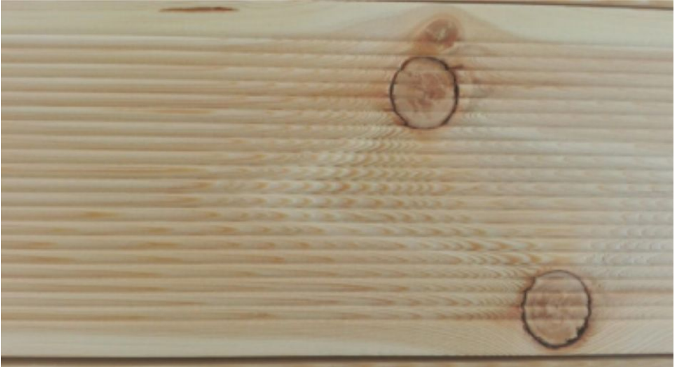
Foto 3 - schwarzumrandete Äste