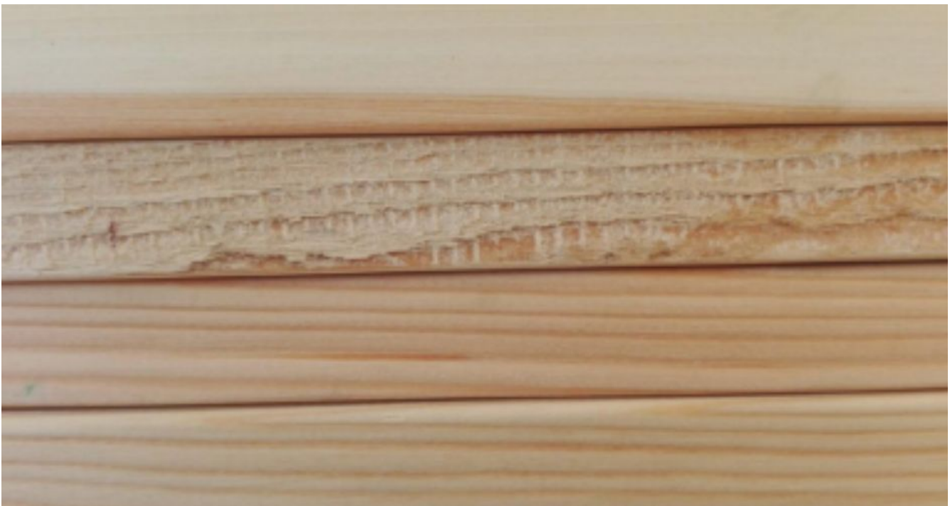
Foto 12 – eine nicht gehobelte, von oben unsichtbare Seite der Holzdielen