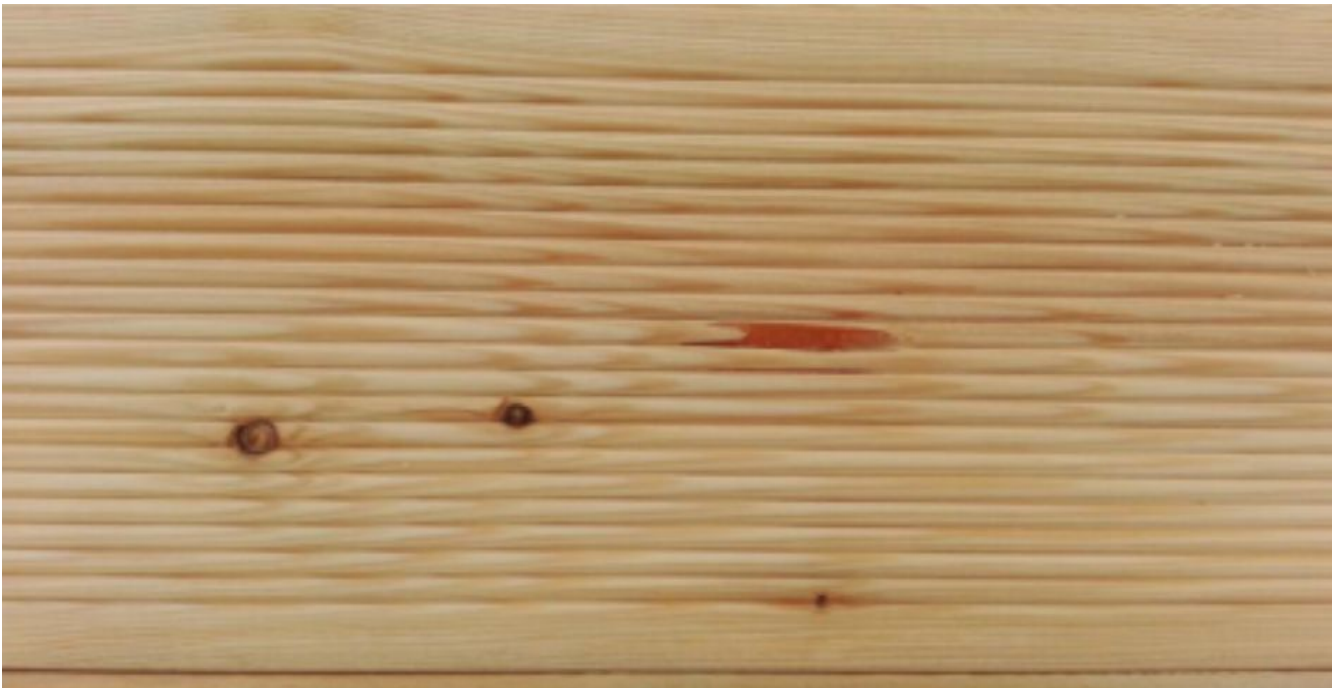
Foto 4 - Äste in Bleistiftform, Harzkammer