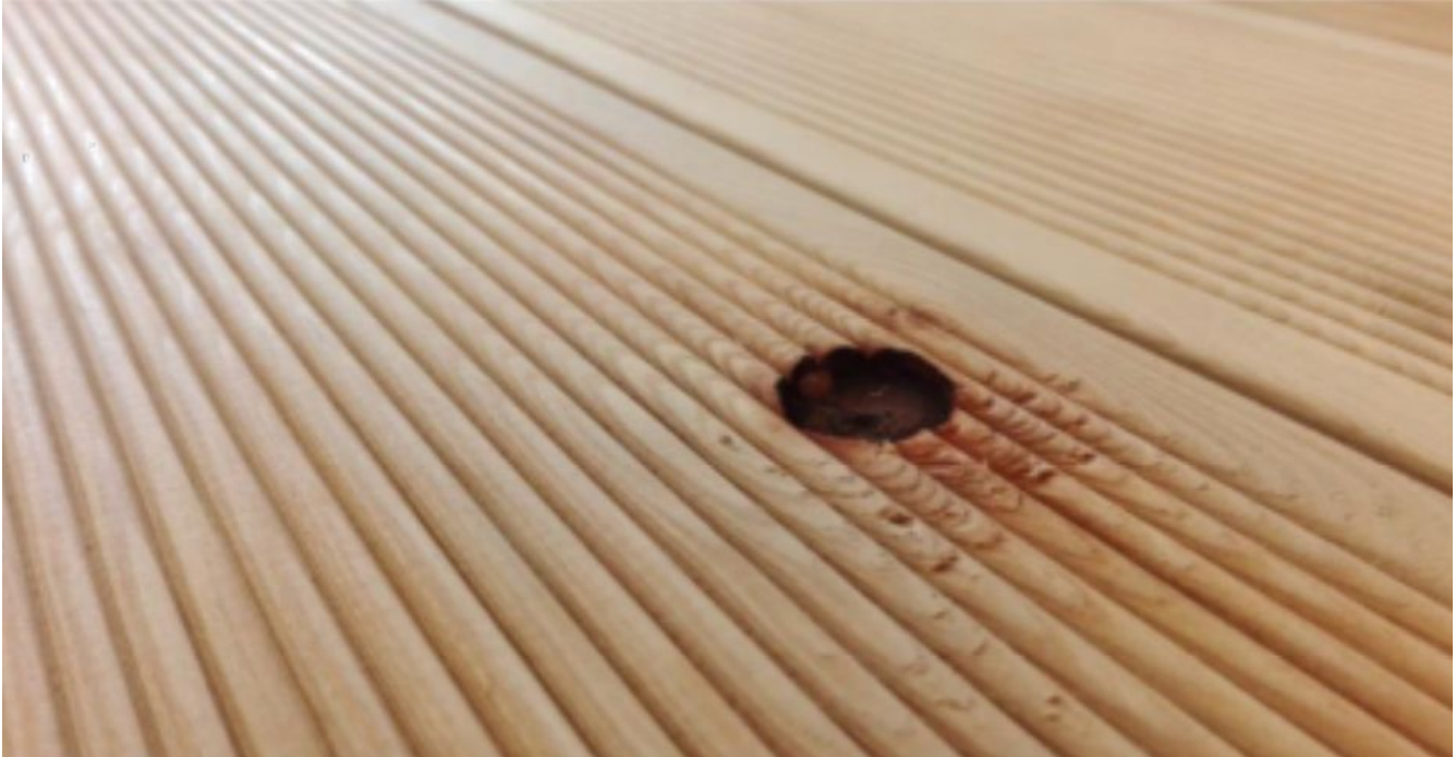
Foto 25 – ein ausgefallener Ast auf der Oberfläche der Holzdielen

Hier unten folgen ein paar beispielhafte Fotos, die den Istbestand von Oberflächen der Holzdielen präsentieren.