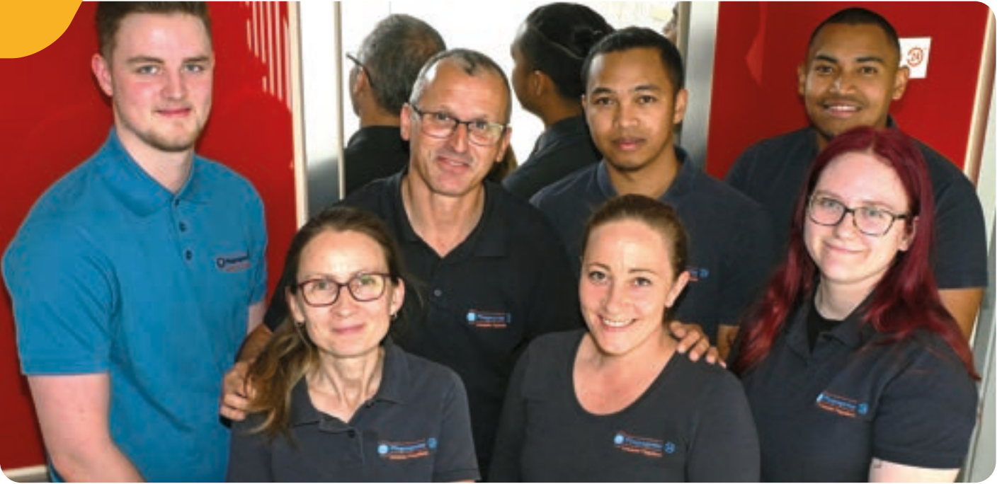
Das Pflegeteam der Pflegeagentur 24 Essen-Bergerhausen