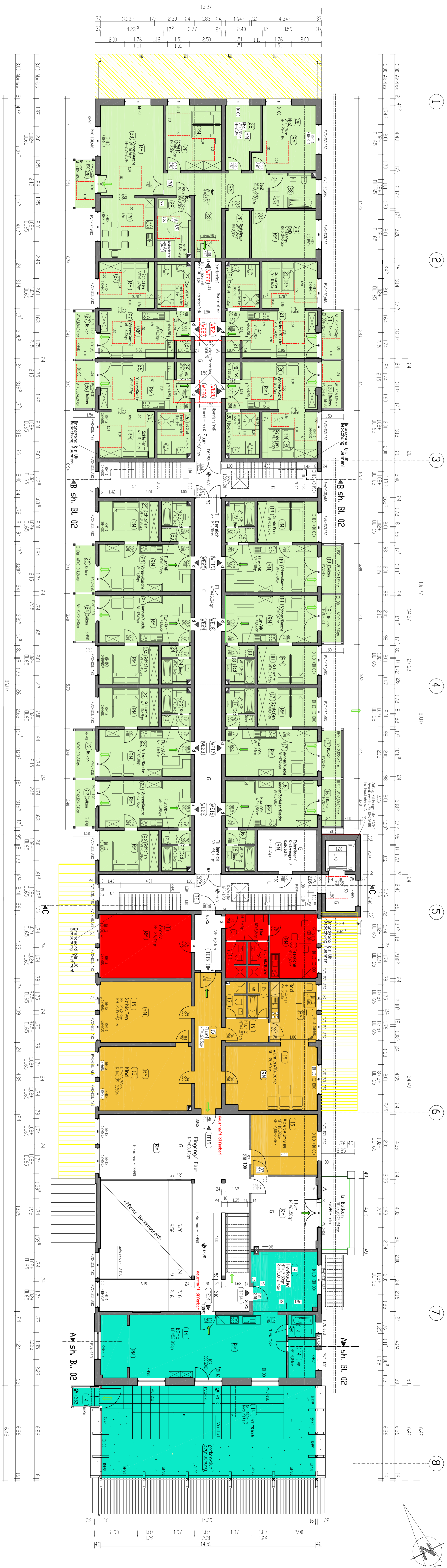
Schritt C-C M 1 : 100