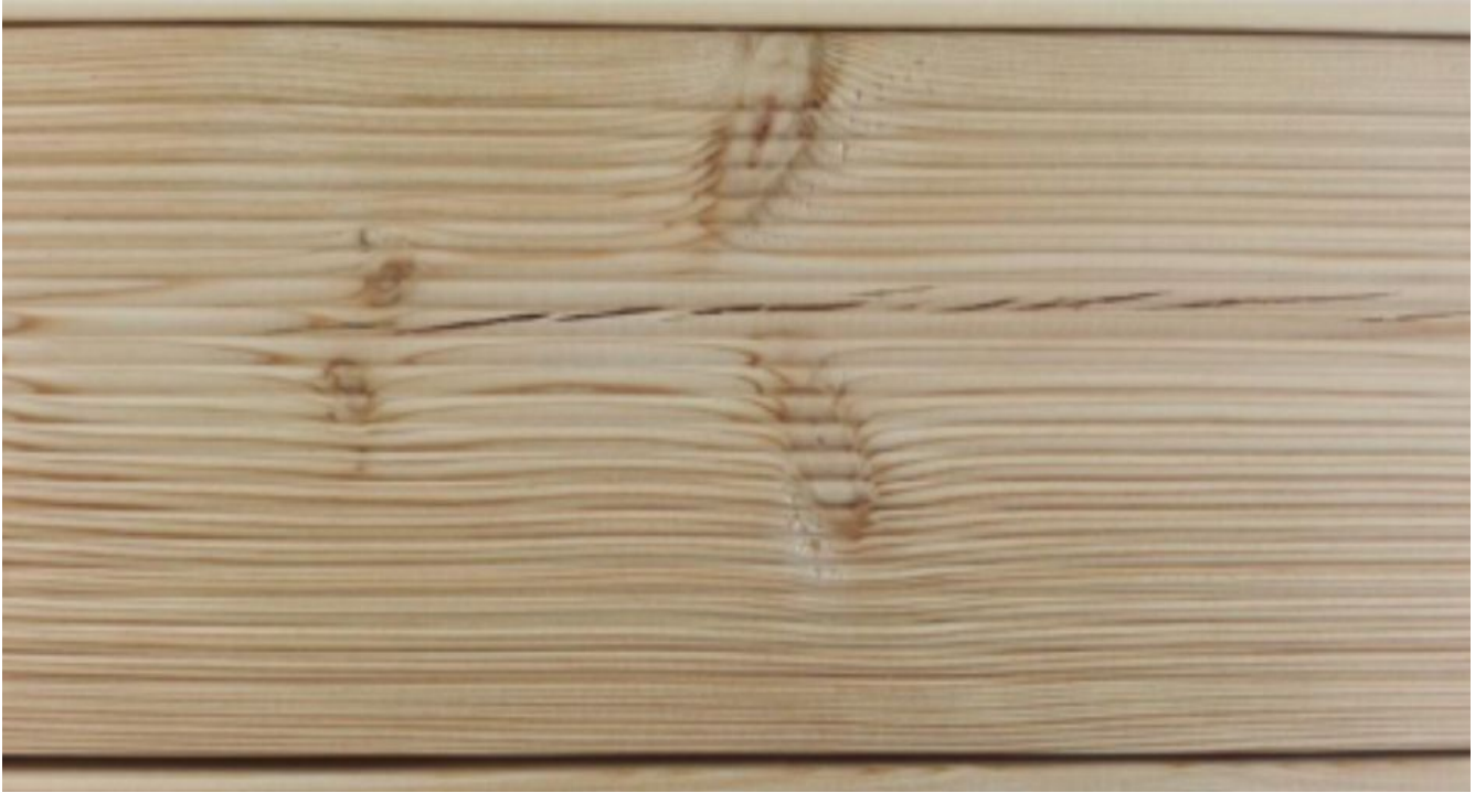
Foto 3 - Haaräste