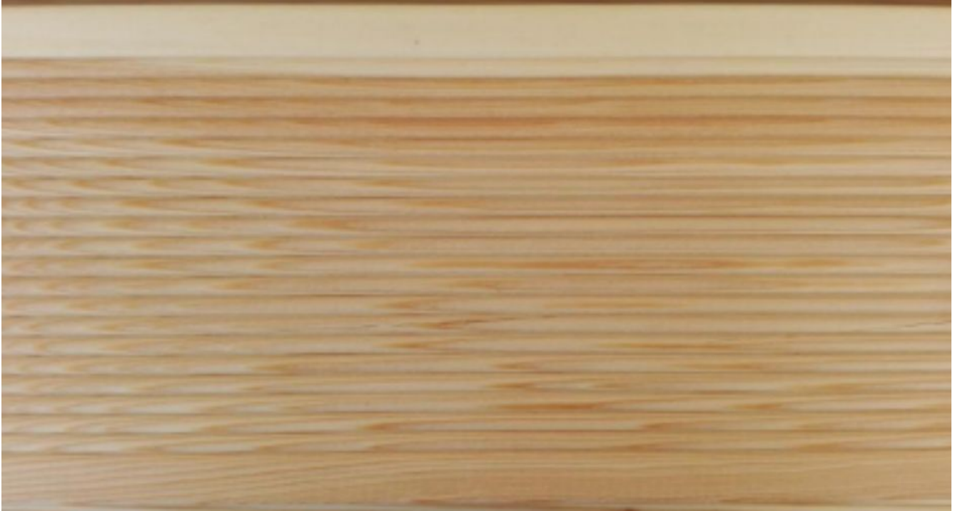
Foto 15 - Splintholz