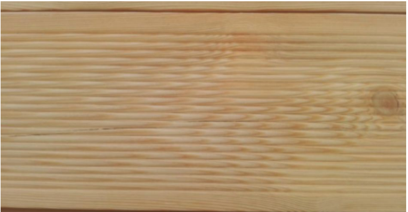
Foto 16 - Haarrisse