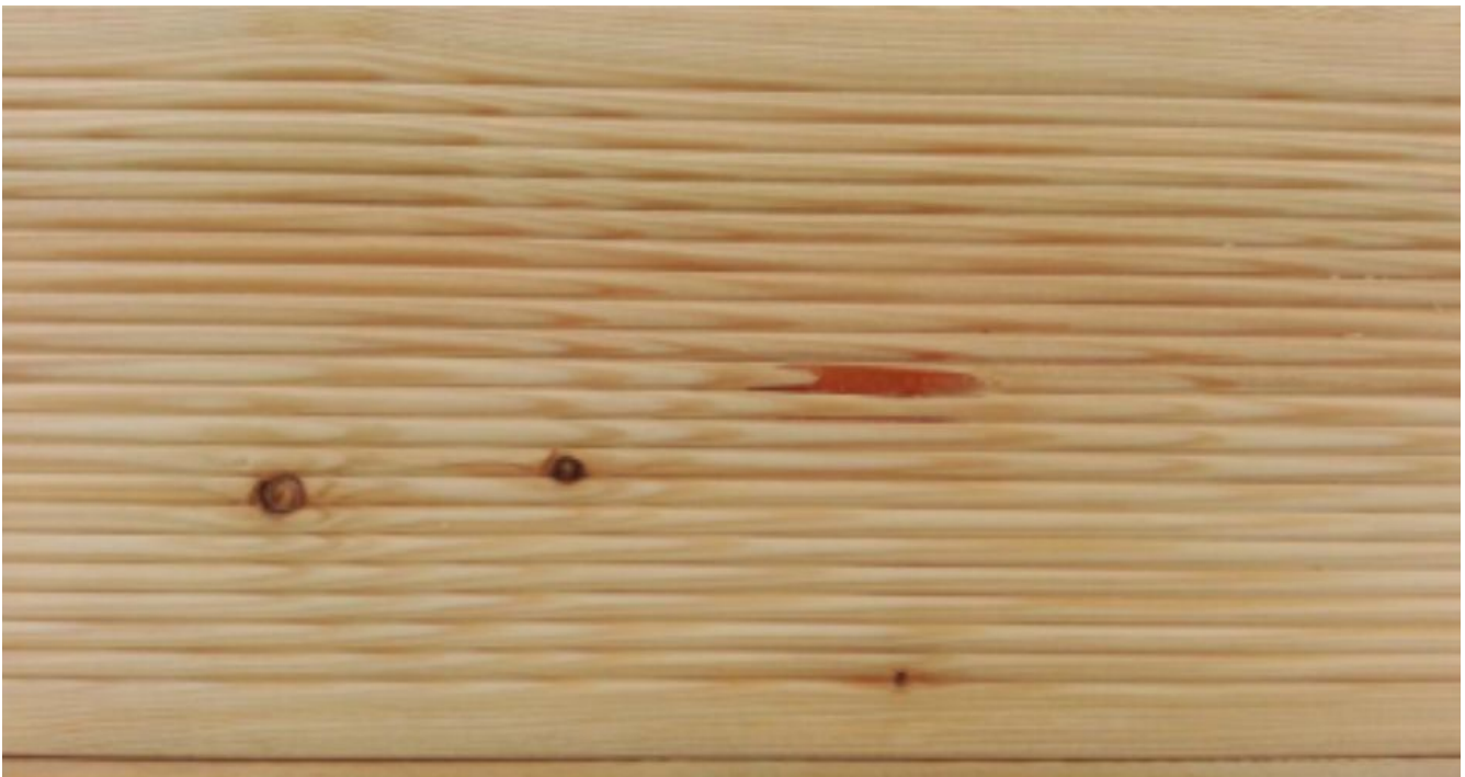
Foto 10 - Äste in Bleistiftform, Harzkammer