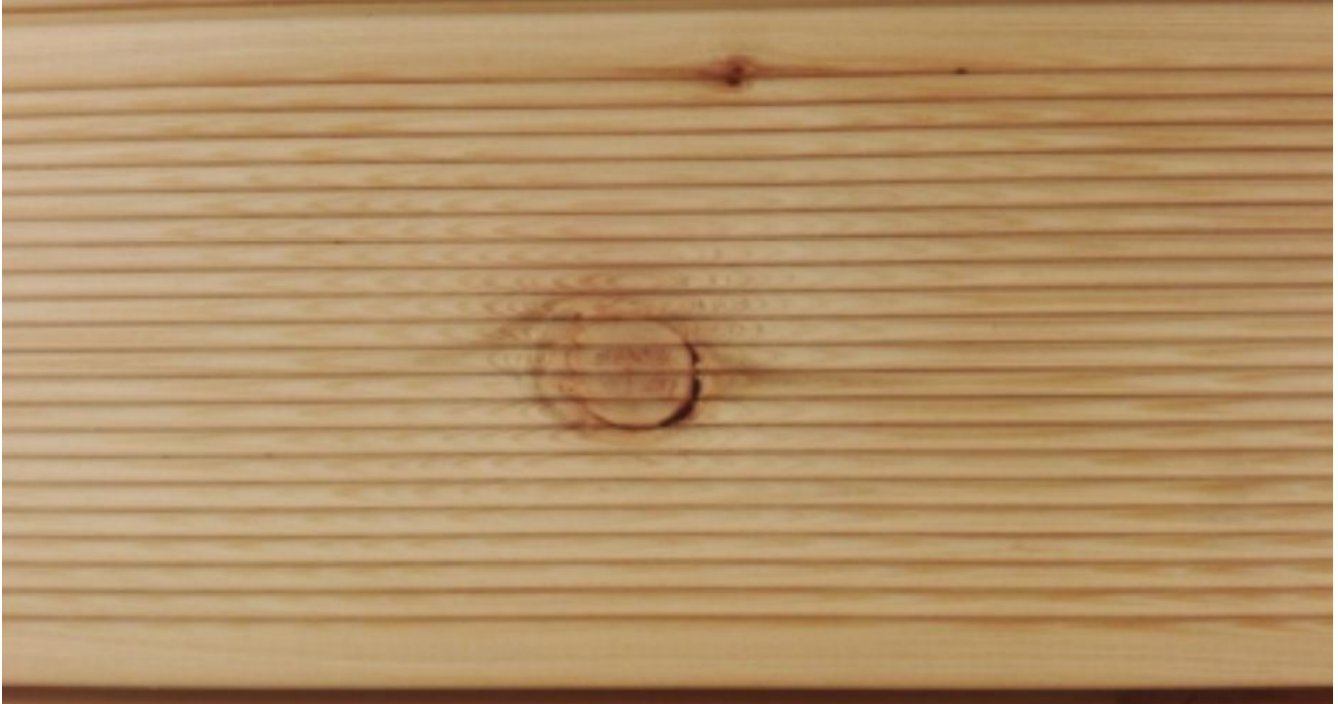
Foto 17 – Ast mit einer schwarzen Hülle eingewachsen im Teilkreis