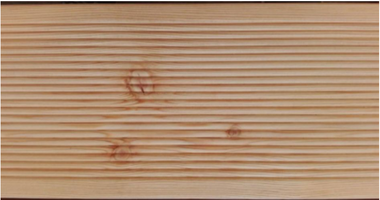
Foto 4 - gesunde Äste in Anhäufung