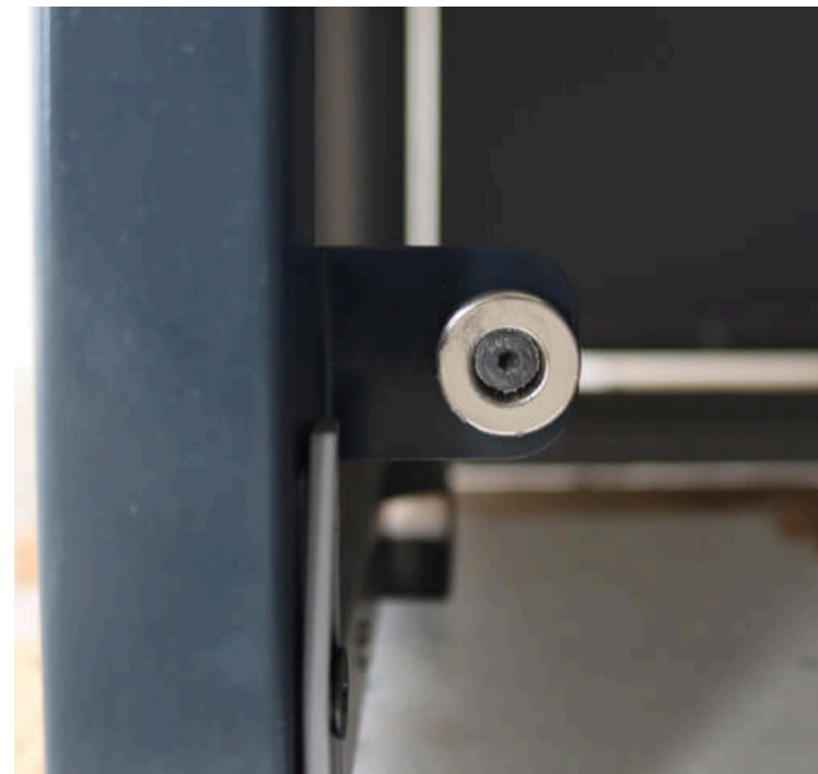
Die Magnetknöpfe im Innenbereich verschliessen die Tür so, dass ein ungewolltes wiederöffnen der Türen verhindert wird.