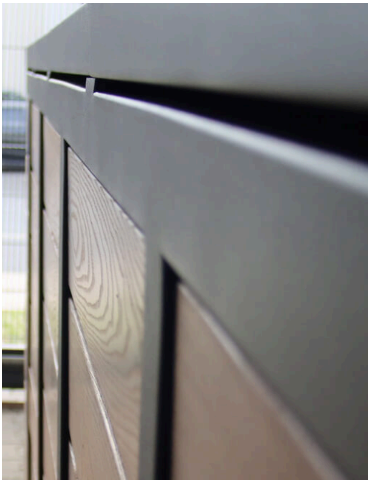
Die Thermo-Holzverkleidung umschließt ebengradig die gesamte Box bis auf die Türen.