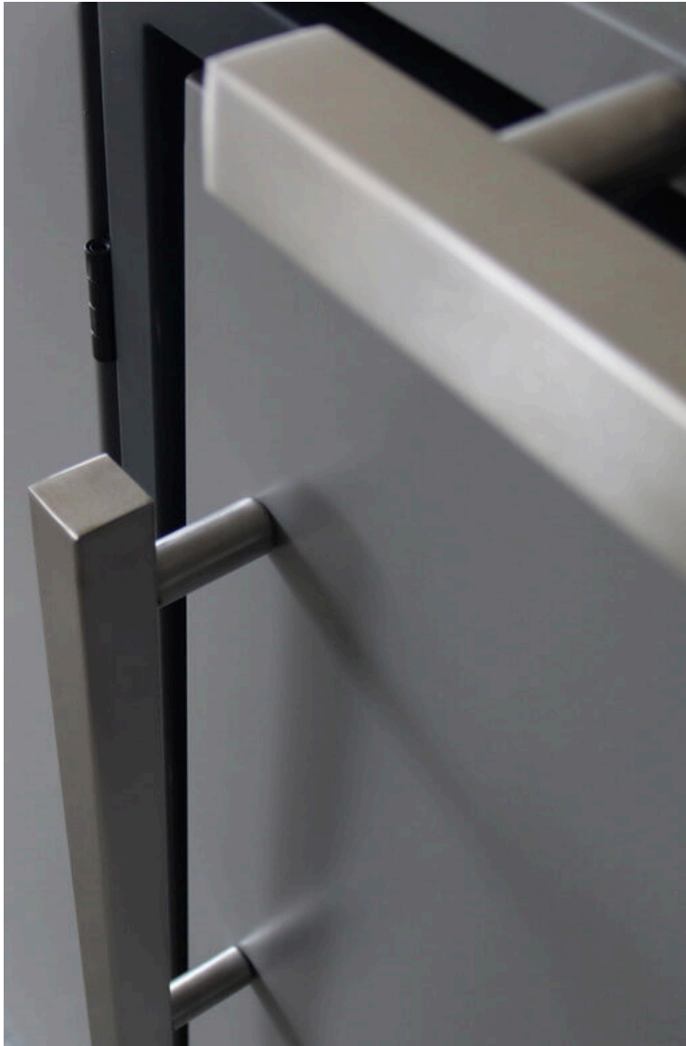
Edelstahlgriffe sind Standard. Die Abbildung zeigt den Griff TYP B.